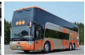
岩手県北バスのダブルデッカー