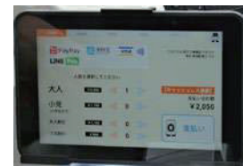
多様な決済手段の導入

ダイナミックルーティングやバスロケータ、MaaS、キャッシュレス化など、デジタルテクノロジーを積極的