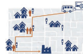
ダイナミックルーティングのイメージ図*1