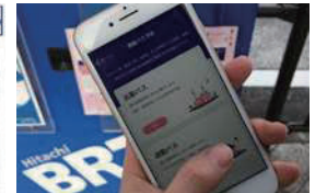
茨城県内の移動手段を検索できるアプリ「Hitachi City MaaS Project」 2